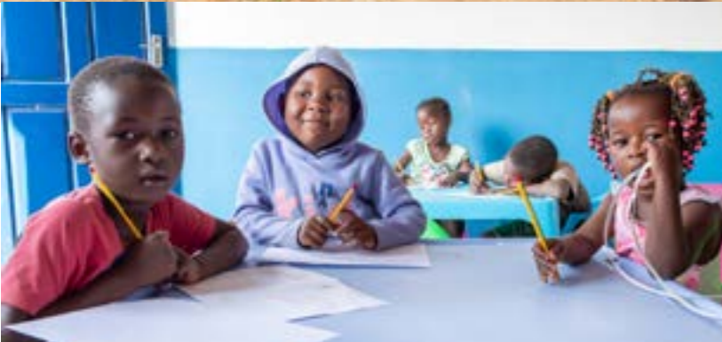
Aldeia Dignity, Matambo MZ Scuola dell'infanzia - fondi CEI 8 x mille