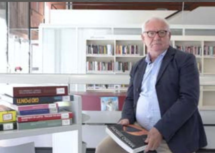
Roma, Milano, Orvieto Dignity eventi