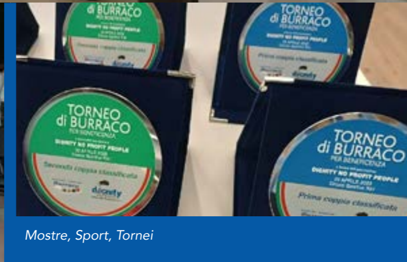
Mostre, Sport, Tornei