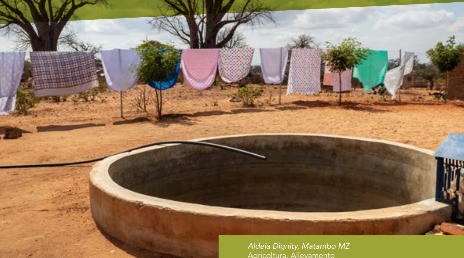
Aldeia Dignity, Matambo MZ Agricoltura, Allevamento