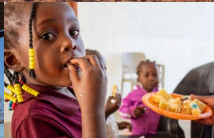
Aldeia Dignity, Matambo MZ Sport, Gioco e Merende