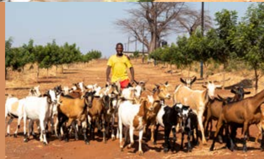
Aldeia Dignity, Matambo MZ Acqua, Alimentazione, Istruzione, Lavoro